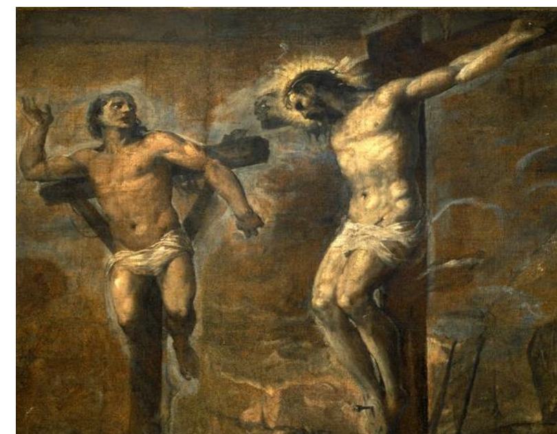
"Jésus Christ et le bon larron", c.1563, Le Titien (1489-1576),

Le 23 novembre 2025 Le Christ, Roi de l'univers