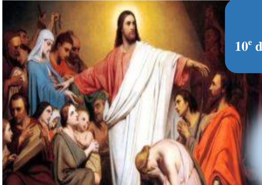
La famille de Jésus par Ary Scheffer - 1854

Le 09 juin 2024 10 e dimanche du temps ordinaire B